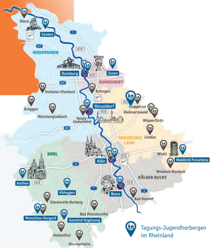
Tagungs-Jugendherbergen im Rheinland

Service-Team der Jugendherbergen im Rheinland Düsseldorfer Str. 1a · 40545 Düsseldorf Tel.: 0211 30263026 · Fax: 0211 30263027 service@djh-rheinland.de