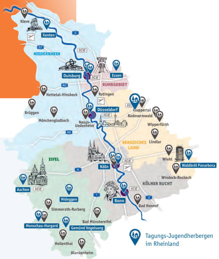
Tagungs-Jugendherbergen im Rheinland

Service-Team der Jugendherbergen im Rheinland Düsseldorfer Str. 1a · 40545 Düsseldorf Tel.: 0211 30263026 · Fax: 0211 30263027 service@djh-rheinland.de