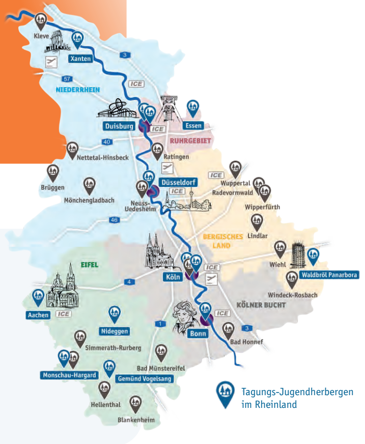
Tagungs-Jugendherbergen im Rheinland

Service-Team der Jugendherbergen im Rheinland Düsseldorfer Str. 1a · 40545 Düsseldorf Tel.: 0211 30263026 · Fax: 0211 30263027 service@djh-rheinland.de