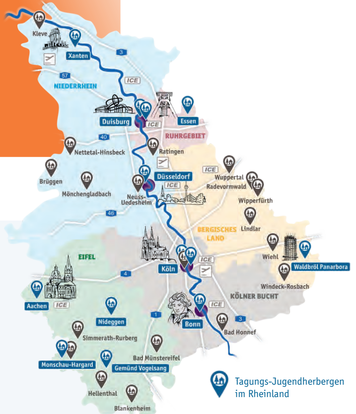
Tagungs-Jugendherbergen im Rheinland

Service-Team der Jugendherbergen im Rheinland Düsseldorfer Str. 1a · 40545 Düsseldorf Tel.: 0211 30263026 · Fax: 0211 30263027 service@djh-rheinland.de