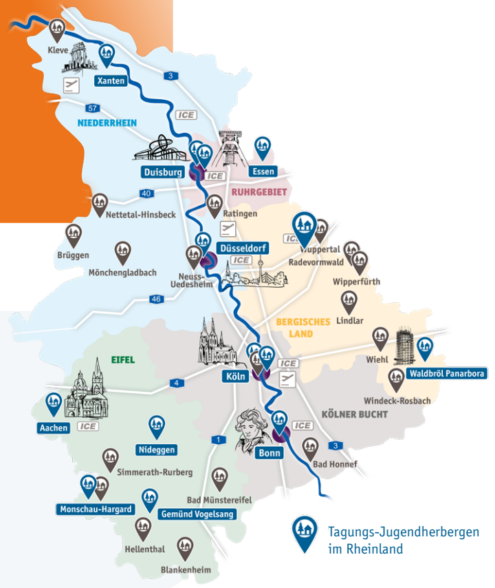
Tagungs-Jugendherbergen im Rheinland

Service-Team der Jugendherbergen im Rheinland Düsseldorfer Str. 1a · 40545 Düsseldorf Tel.: 0211 30263026 · Fax: 0211 30263027 service@djh-rheinland.de