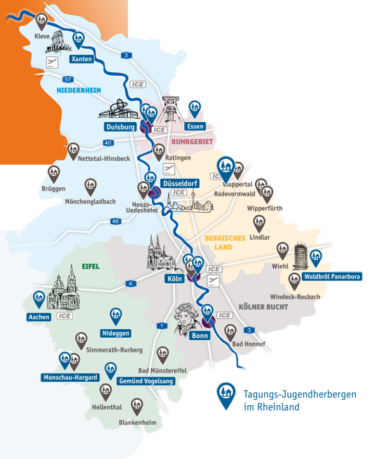
Tagungs-Jugendherbergen im Rheinland

Service-Team der Jugendherbergen im Rheinland Düsseldorfer Str. 1a · 40545 Düsseldorf Tel.: 0211 30263026 · Fax: 0211 30263027 service@djh-rheinland.de