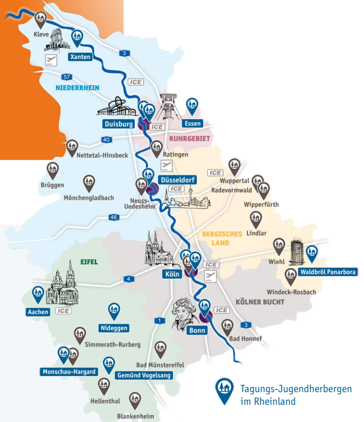
Tagungs-Jugendherbergen im Rheinland

Service-Team der Jugendherbergen im Rheinland Düsseldorfer Str. 1a · 40545 Düsseldorf Tel.: 0211 30263026 · Fax: 0211 30263027 service@djh-rheinland.de